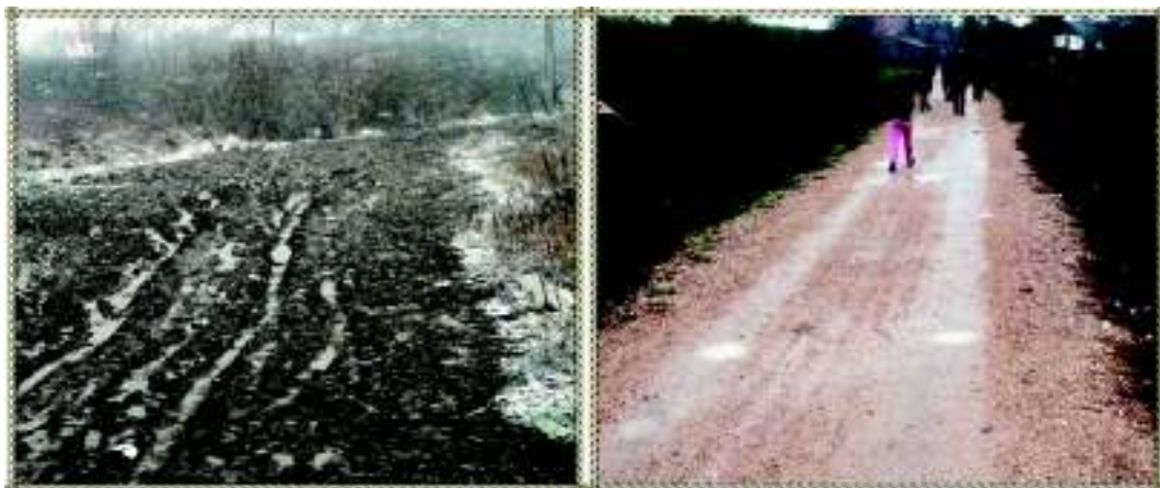
De weg door de dalkom voor en na de reparatie.