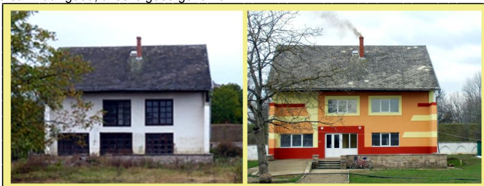
Het aangekochte pand voor en na de verbouwing

De andere taal en cultuur vraagt om investeringen van beide kanten om misverstanden te voorkomen dan wel op te lossen. Het bespreken van het projectplan en het kiezen van verwoordingen vraagt tijd. Dit mede door de vertalingen Nederlands - Engels - Hongaars en vice versa. Maar goed, alles is goed gekomen.