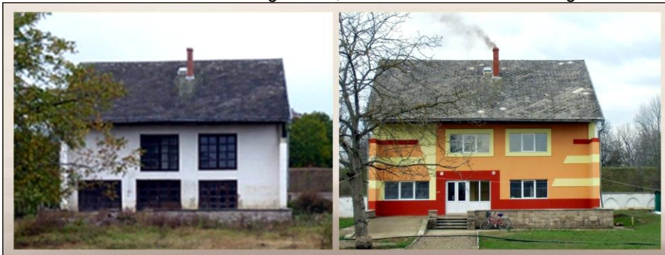
Huis voor en na de verbouwing

We kijken dit jaar terug met gemengde gevoelens. We hadden gehoopt dat de Immanuelschool vanaf september 2013 in het nieuwe gebouw zou kunnen beginnen. Het heeft de laatste 2 jaar niet aan de werkgroepen gelegen want er is in de zomermaanden van 2012 en 2013 heel veel werk verzet. Augustus 2013 verliet de Ichthus groep uit Amersfoort Mezövári met een dankbaar gevoel. We dachten dat alle klussen waren geklaard en niets de opening in september nog in de weg kon staan. Alleen moest er nog een nieuwe meterkast geplaatst worden met daaraan verbonden de elektrische hoofdkabel. Waar wij Nederlanders denken in uren/dagen, worden dit voor onze Oekraïense oosterburen echter maanden. Uiteindelijk is in februari 2014 de elektrische aansluiting geïnstalleerd. De voortvarende start van de Bisschop in 2012 is door de trage werking van de overheid weer te niet gedaan. Erger nog, het vertraagde de ingebruikname van het nieuwe gebouw. Tijdens de reizen zeggen mensen het geregeld tegen elkaar: 'Dit is Oekraïne'. Soms met een glimlach, soms is het een verzuchting.