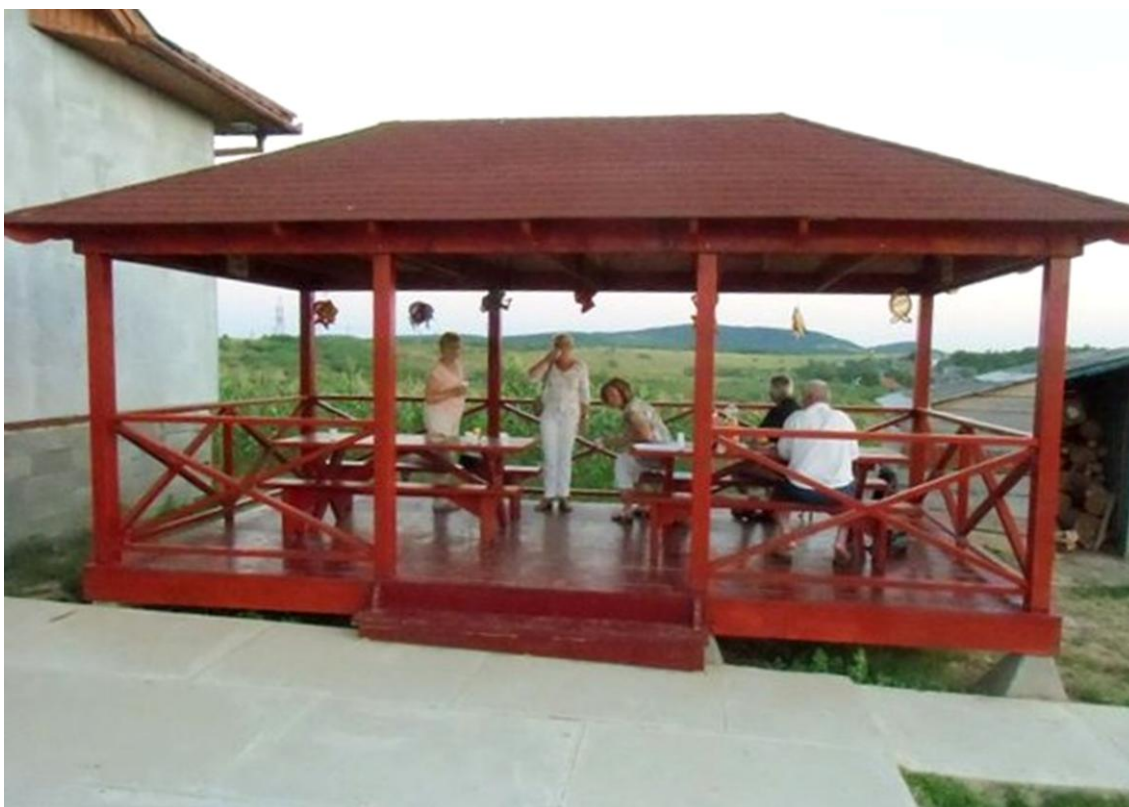
Vanuit de PKN te Doorn kwam er een groep naar Nagyberg. Tijdens hun werkweek realiseerden zij dit paviljoen.