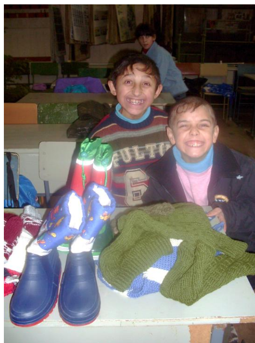
Januari 2010: Kinderen in Nagyberég krijgen laarzen en warme kleren.

In de meerjarenbegroting 2011-2016 treft u een begroting aan van de voorgenomen projecten.